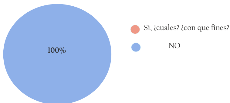
Figura 1. ¿La EPD-R se vincula con otras asociaciones, instituciones, empresas y/u otras organizaciones de la comunidad?

El análisis descriptivo de los resultados arroja que, el 100% de los encuestados respondió de manera negativa en cuanto a la existencia de un vínculo por parte la escuela pública digital rural de Los Manantiales con otras entidades de la comunidad (Figura 1).